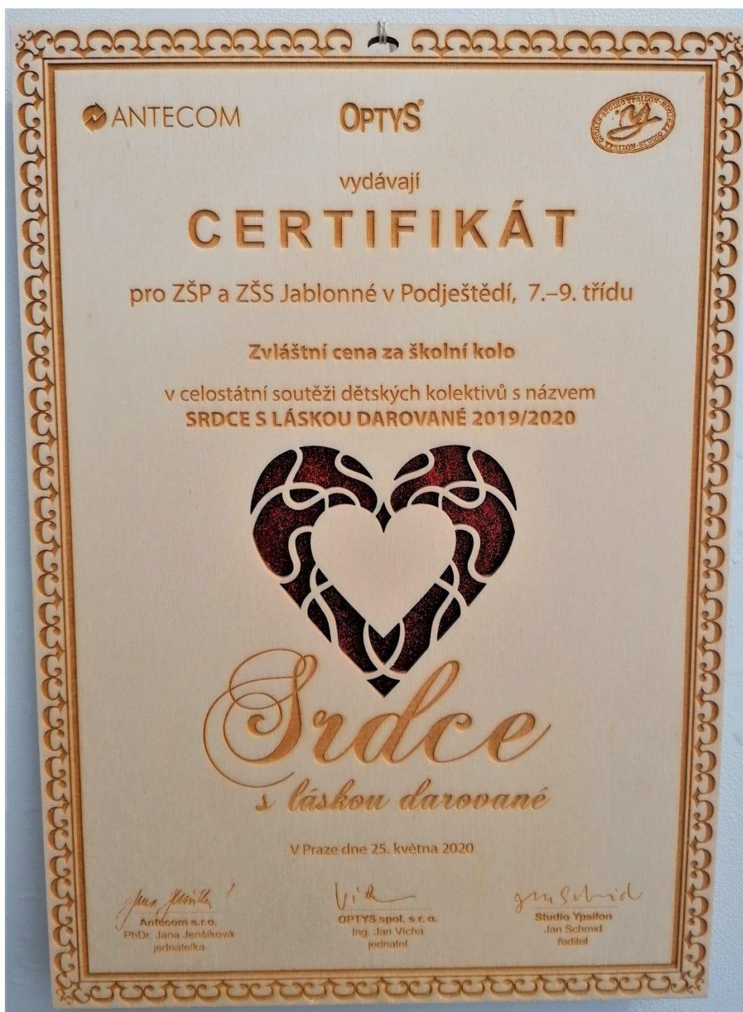
Zvláštní cena poroty v soutěži Srdce s láskou darované