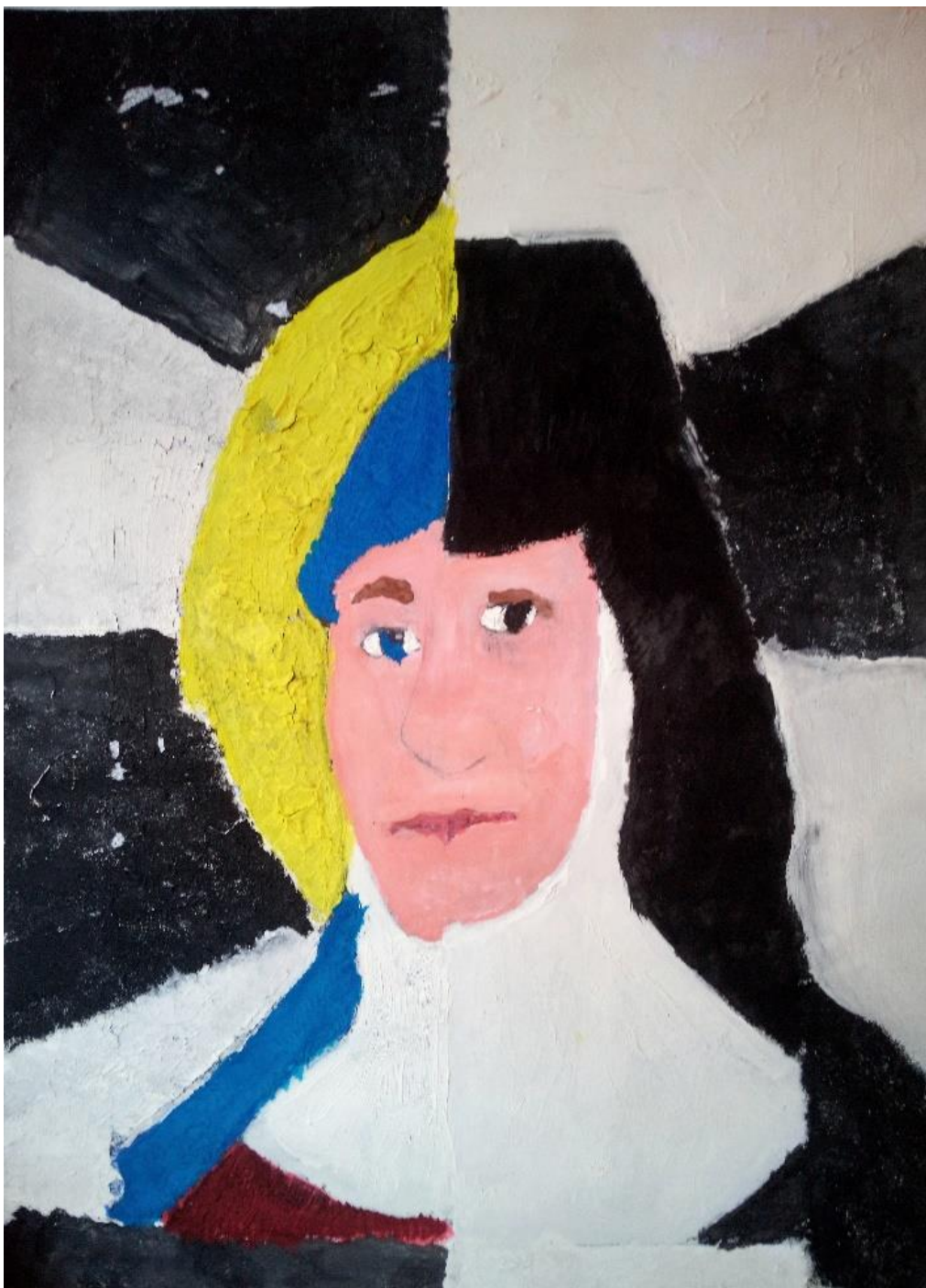
Oceněná malba v soutěži V srdci paní Zdislavy